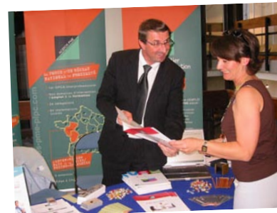
Assemblée Générale des Experts Comptables Vendredi 19 septembre à Angers

> Pour tout renseignement, contactez le CEECCARA au 02 41