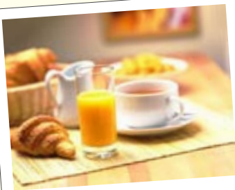
Petits déjeuners AGEFOS PME